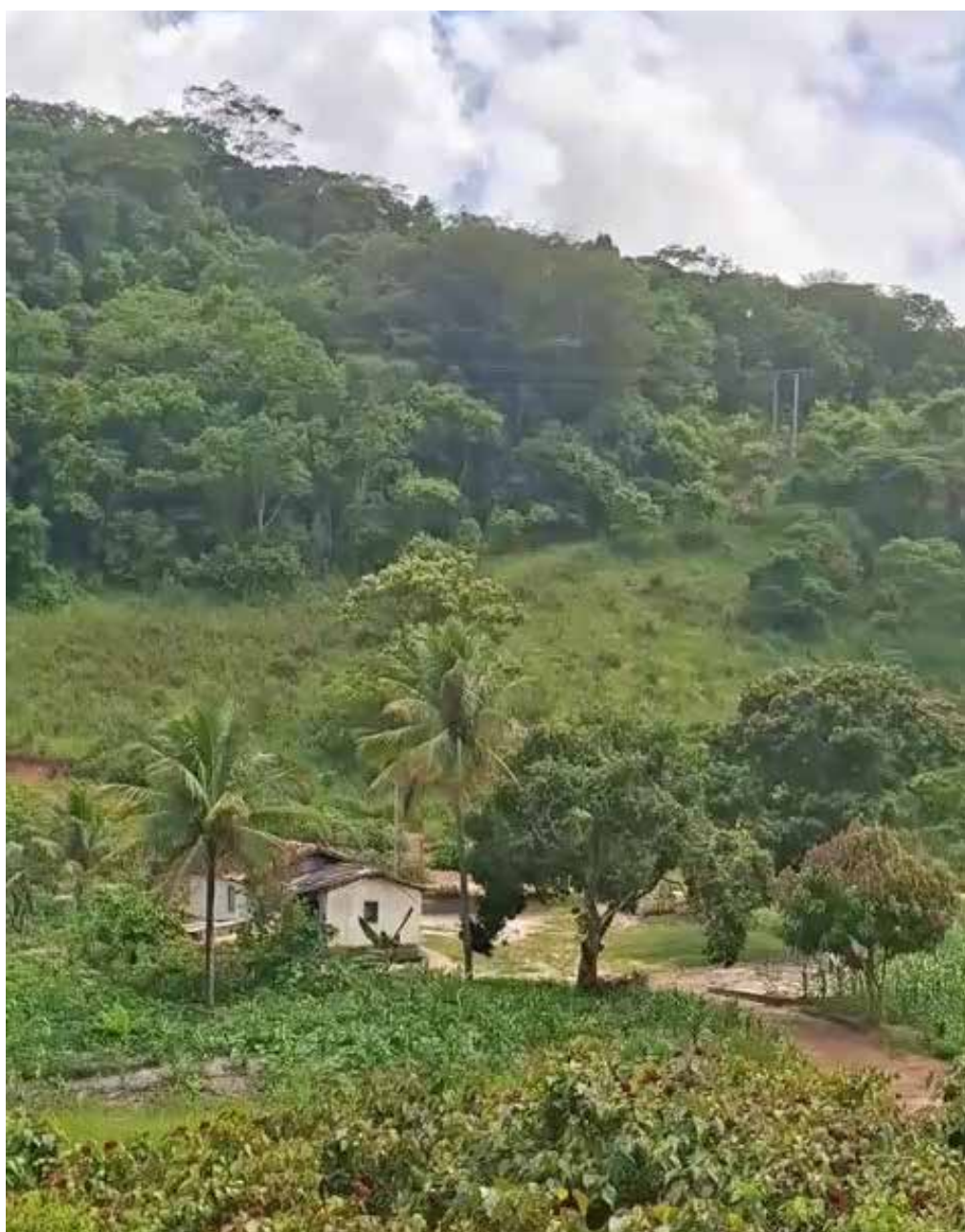
In questa pagina: Casa Come Noi a Ouro Verde; Il terreno coltivato dalla ACOP di Ouro Verde.